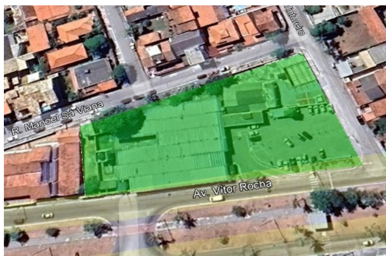
Figura 1 - Localização da UPA I

Estudo Técnico Preliminar elaborado pelo Setor de Engenharia da Secretaria Municipal de Saúde de Cabo Frio para atender a etapa da fase de planejamento e apresentar os devidos estudos para a contratação de solução para a necessidade de reforma e ampliação da unidade de pronto atendimento - UPA I, localizado na Av. Vitor Rocha, 410 - Parque Burle, Cabo Frio - RJ.